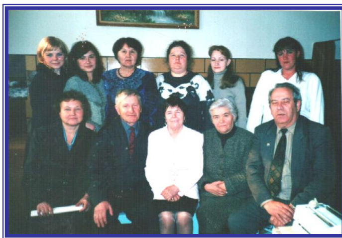
2002 г. сотрудники кафедры «Общая зоотехния» (1974 год - Кафедра кормления и разведения животных).

В 1974 году пришла работать в Приморского СХИ на кафедру кормления и разведения животных сначала в должности лаборанта, а потом младшего научного сотрудника.