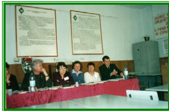
Защита дипломного проекта