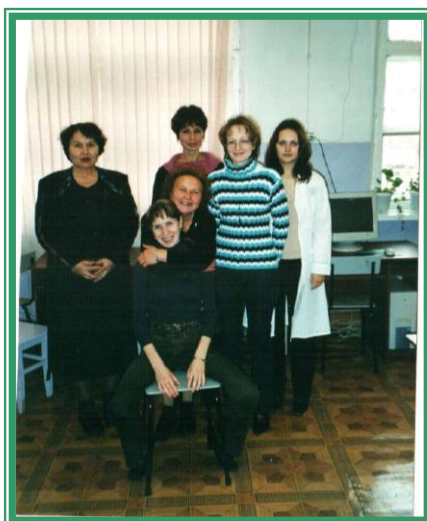
Сотрудники кафедры «Общая зоотехния» (бывшая кафедра кормления и разведения).

- В ПГСХА я работаю с 1974 года: 1 год работала старшим лаборантом, а затем научным сотрудником в лаборатории кормов, с 1977 года «на кафедре «Общая зоотехния» (бывшая кафедра кормления и разведения).