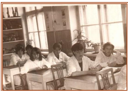
1966 г. Приморский с/х институт I курс, зоотехнический факультет

После того как в 1971 году с отличием окончила институт, работала по распределению зоотехником отделения в зверосовхозе Ливадийский.