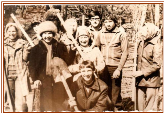
Работа в лагере «Золотой колос» с курируемой группой