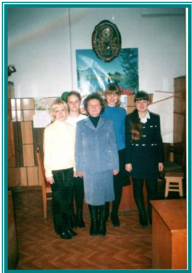
С дипломниками зооветеринарного факультета, 2003 г.