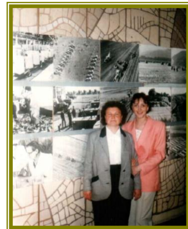
1996 г. с дипломницей

Вела работу по хозяйственно-биологическим особенностям различных пород скота в условиях Приморского края, изучала действие витаминов, метионина на рост и развитие телят до 6-ти месячного возраста. Результаты исследований использовались для написания дипломных работ студентов, были внедрены в учебно-опытном хозяйстве Приморского СХИ.