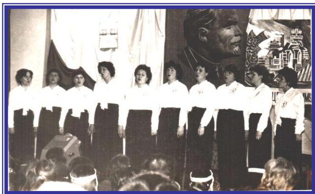
Хор сотрудников ПГСХА

Принимала активное участие в профессиональной жизни коллег и института, являлась членом комитета народного контроля института и общественным профоргом коллектива лаборатории. Уделяет много внимания методической и воспитательной работе.