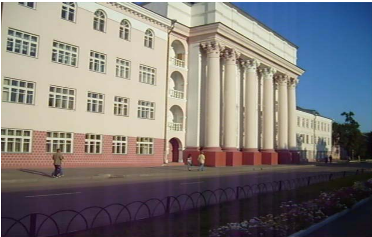
Главный корпус ПГСХА (Блюхера, 44)