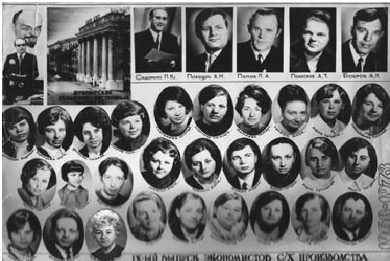
IX-ый выпуск экономистов сельскохозяйственного производства (нижний ряд третья слева)

На практике нам, студентам тех лет, было легко, поскольку нас готовили в учебных аудиториях к практической деятельности: составляли производственно-финансовые планы, рассчитывали технологические карты, знали экономику сельскохозяйственного производства, анализ, оплату труда. Да и принимали нас в хозяйствах с удовольствием, доверяли всю экономическую работу.