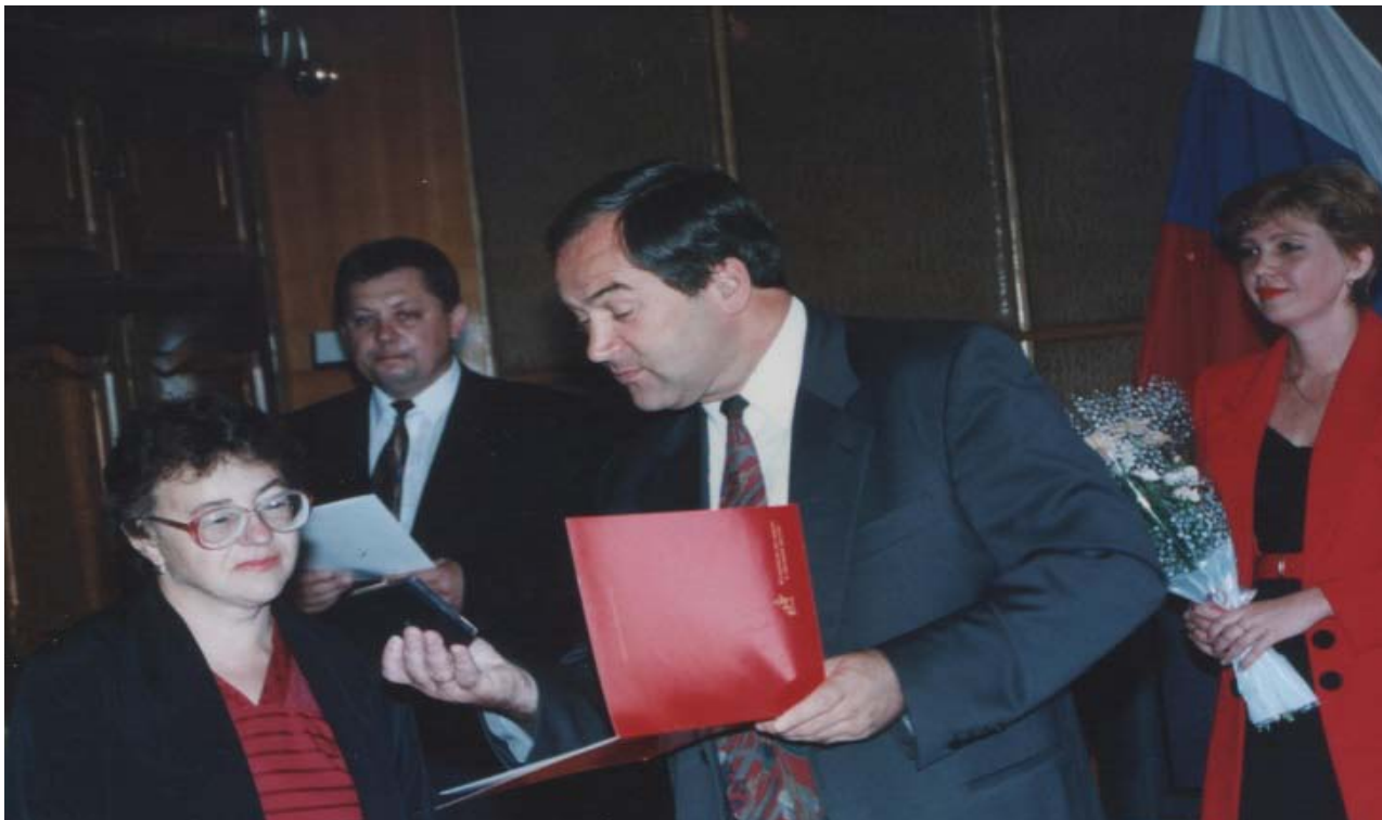
Фотография, сделанная в момент вручения Свидетельства, в настоящее время находится в экспозициях музея ПГСХА на проспекте Блюхера, 44.

Шел 1995 год. Молодой губернатор Приморского края Евгений Иванович Наздратенко решил отметить лучших преподавателей высших и средних учебных заведений края.